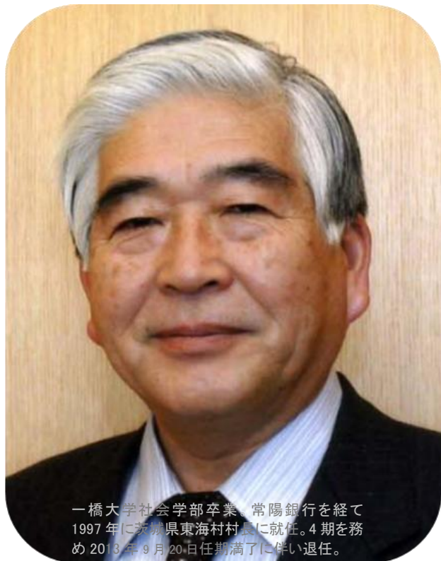
一橋大学社会学部卒業。常陽銀行を経て1997年に茨城県東海村村長に就任。4期を務め2013年9月20日任期満了に伴い退任。