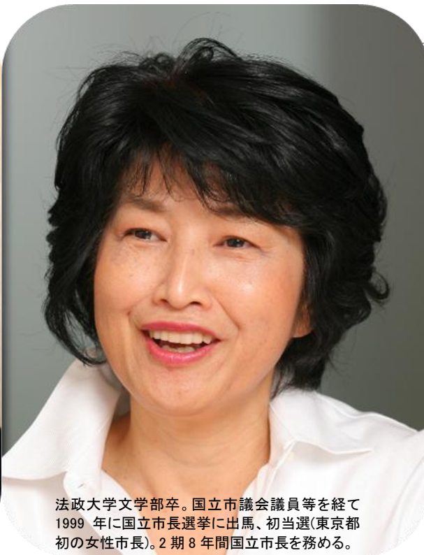
法政大学文学部卒。国立市議会議員等を経て1999年に国立市長選挙に出馬、初当選(東京都初の女性市長)。2期8年間国立市長を務める。